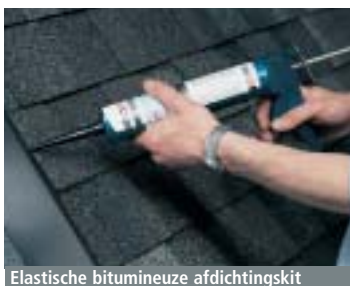
Elastische bitumineuze afdichtingskit