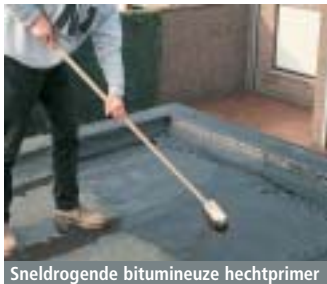
Sneldrogende bitumineuze hechtprimer