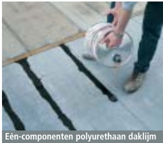
Eén-componenten polyurethaan daklijm