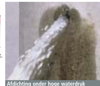
Afdichting onder hoge waterdruk