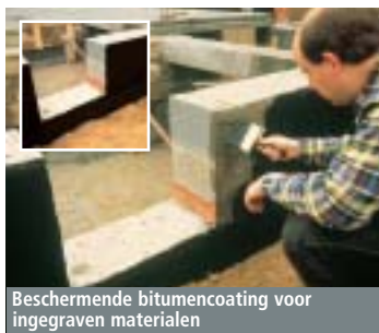
Beschermende bitumencoating voor ingegraven materialen