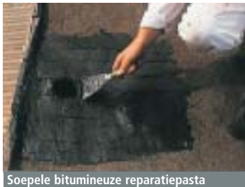
Soepele bitumineuze reparatiepasta