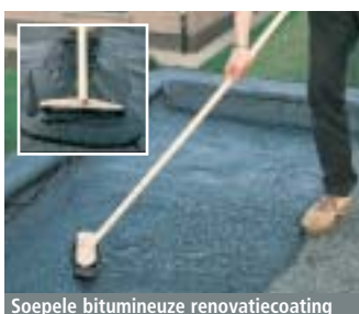
Soepele bitumineuze renovatiecoating