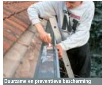
Duurzame en preventieve bescherming