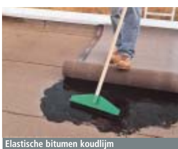
Elastische bitumen koudlijm